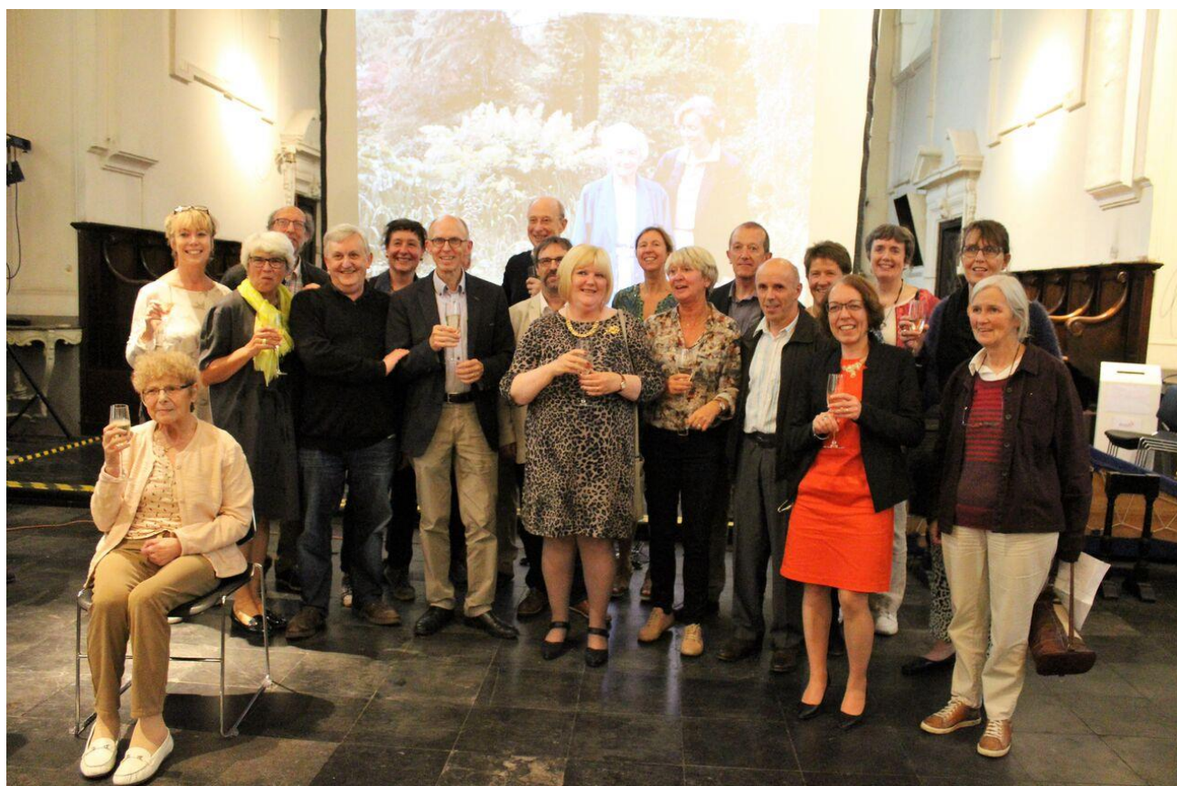
vrijwilligers van de jaren 1980 - 1990