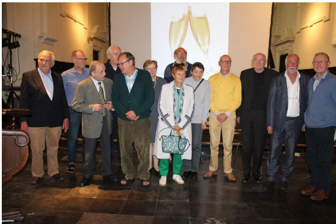
vrijwilligers van de jaren 1960 - 1970