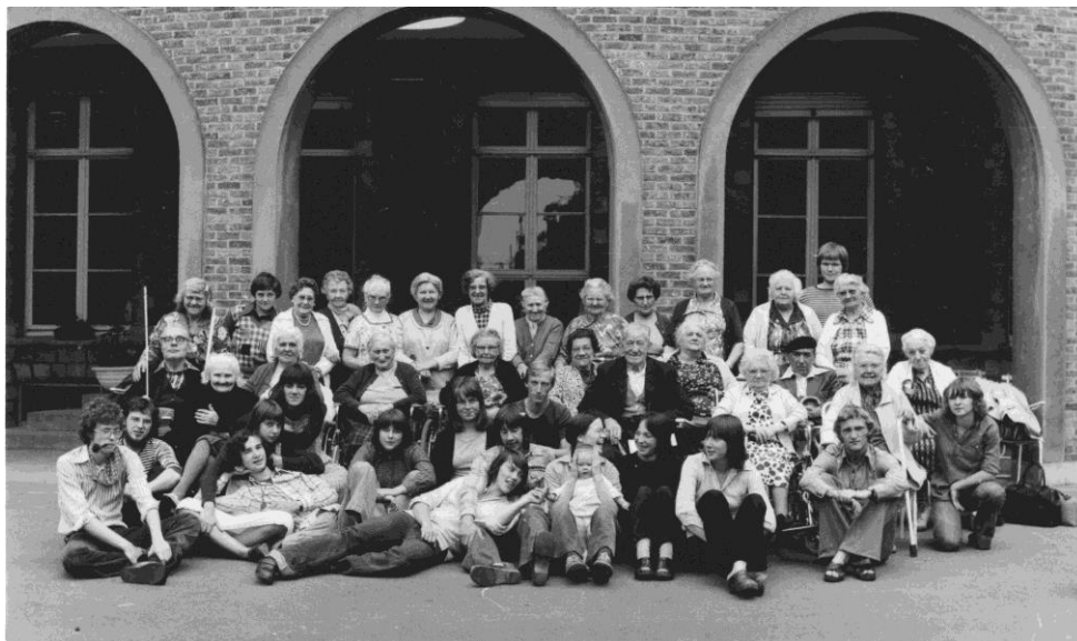
Vakantie te Dadizele (midden jaren '70)